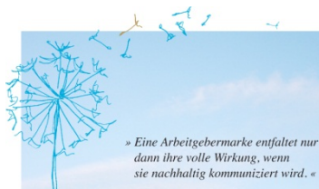
Employer Branding & Medien