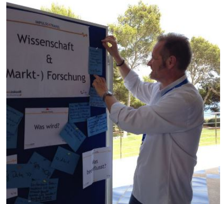
Impulse4travel Workshop für TUI in Mallorca

Innovationserfahrung als Coach: Konzeption und Durchführung von Innovations-Workshops mit maßgeschneiderten Formaten und Pfaden (u.a. Ravensburger, E-Plus, Baby Walz, neckermann.de, Outlecity Metzingen, EDEKA)