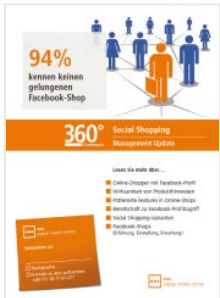
Social Shopping Facebook Commerce

Studienleitung, Wissenschaftliche Redaktion, Fullservice incl. / excl. Agenturleistung