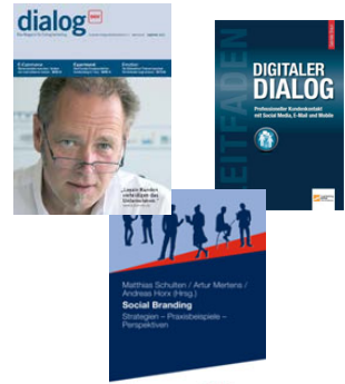
Interviews & Publikationen dazu