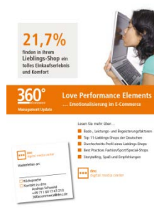
Emotionalisierung im E-Commerce