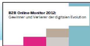
Interviews & Publikationen dazu