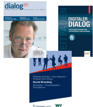
Interviews & Publikationen dazu