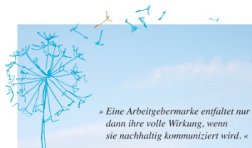
Employer Branding & Medien