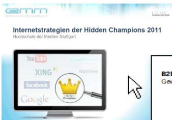
Hidden Champions im Web