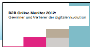
Interviews & Publikationen dazu