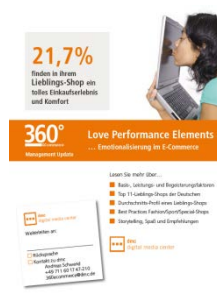
Emotionalisierung im E-Commerce