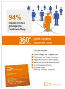
Social Shopping Facebook Commerce

Studienleitung, Wissenschaftliche Redaktion, Fullservice incl. / excl. Agenturleistung