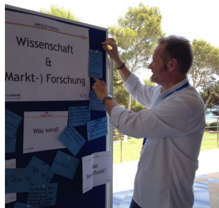
Impulse4travel Workshop für TUI in Mallorca

Innovationserfahrung als Coach: Konzeption und Durchführung von Innovations-Workshops mit maßgeschneiderten Formaten und Pfaden (u.a. Ravensburger, E-Plus, Baby Walz, neckermann.de)